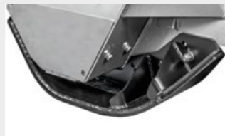
Slitte di profondità

Denti ripper aiutano l'allineamento degli alberi da tritare che una volta abbattuti possono essere rastrellati per la tritrazione finale