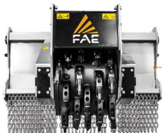
Trasmissione a cinghie