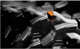
Possibilità di avere il rotore con utensili opzionali