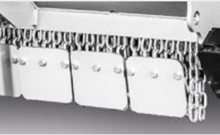
Piastre avvitate per catene di protezione