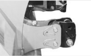
Regolazione attacco a 3 punti

Max. 1: solo con rotore Max. 2: massima profondità (massima profondità di lavoro dipende dalle condizioni del terreno). I dati si riferiscono alla macchina senza optional. I dati tecnici riportati nel presente catalogo possono subire modifiche senza preavviso.