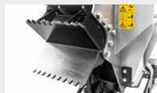
Bec excavateur frontal