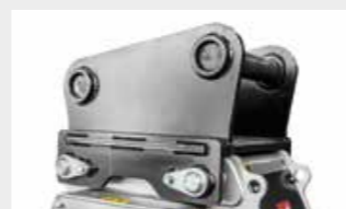
Plaque d'attache boulonnée (suivant les mesures)