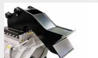
Plaque d'attache boulonnée et pied d'appui (suivant les mesures)