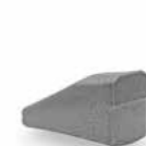
OUTIL BAZ (marteau lateral)