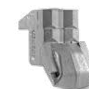
OUTIL STC/3/FP (marteau lateral)