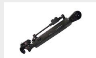
Attelage 3 points réglable