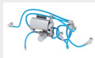
Le système Water Spray System sert à la fois à refroidir et à mélanger