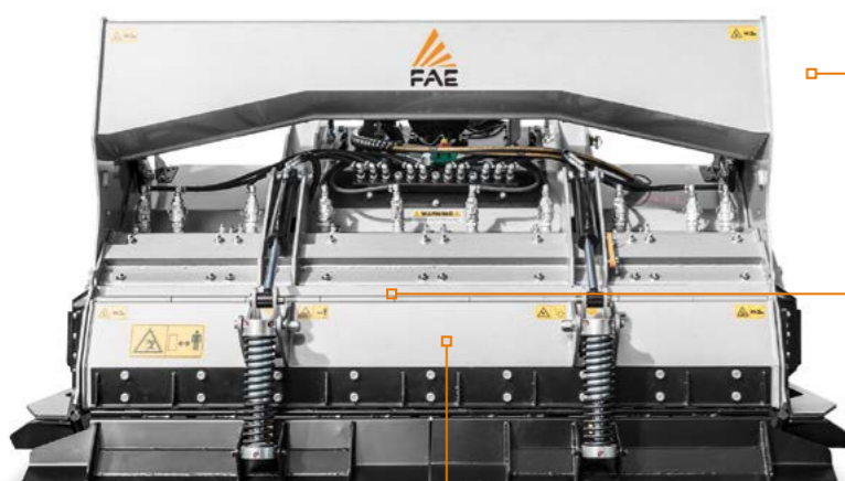
Capot arrière à réglage hydraulique

Protection intérieur pour utiliser la machine dans des conditions extrêmes