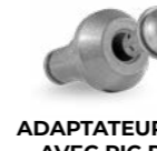
ADAPTATEUR R/65 AVEC PIC R/44 (option)