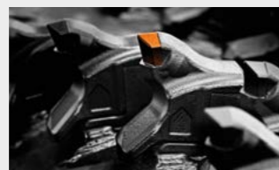
Possibilité de choisir entre différents types d'outils