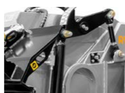
Patins autonivelants avec contrôle hydraulique de la profondeur