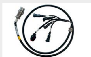
Câblage de connexion Câblage adaptateur permettant une connexion Plug & Play avec les chargeuses compactes les plus courantes