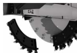
Disques de coupe modulables de 8, 10 ou 12 cm