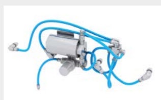
Système d'injection d'eau WSS Basic pour réduire la quantité de poussière et refroidir les outils