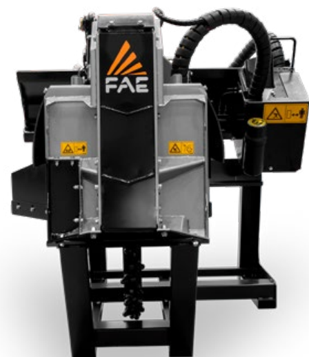
Système de translation hydraulique pour un positionnement précis sur la surface de travail