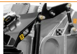
Patins autonivelants avec contrôle hydraulique de la profondeur