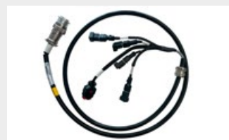
Câblage de connexion Câblage adaptateur permettant une connexion Plug & Play avec les chargeuses compactes les plus courantes