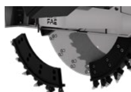
Disques de coupe modulables de 3.2, 4 ou 4.7 inches