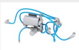
Système d'injection d'eau WSS Basic pour réduire la quantité de poussière et refroidir les outils