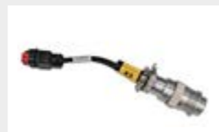
Câblage de connexion Câblage adaptateur permettant une connexion Plug & Play avec les chargeuses compactes les plus courantes