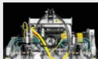
Système d'injection d'eau WSS Basic pour réduire la quantité de poussière et refroidir les outils