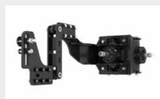
Système de réglage du parallélisme type W