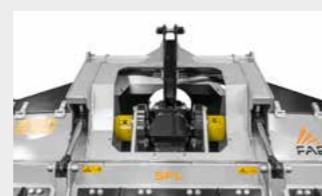
Système de réglage du parallélisme type Z