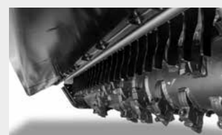
Grille du capot