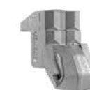
OUTIL C/3/SS (marteau lateral)