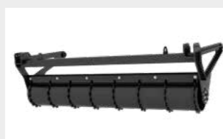
Rouleau de support à réglage hydraulique