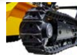
CHENILLES EN ACIER (option)