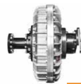
Lámina interna con revestimiento anti desgaste FCP

Embrague de transmisión hidráulico para proteger las transmisiones durante la etapa de acople al tractor (arranque suave) y que mejora el rendimiento del equipo