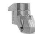
DIENTE STC/3/FP (raspador lateral)