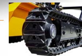
ORUGAS DE ACERO (option)

El tren de rodaje cuenta con una vía variable hidráulica con semitrenes independientes, con sistema de tensado automático, para operar en las condiciones más difíciles gracias a la estructura de la oruga de goma, al sistema de rodillos y a las ruedas tensoras.