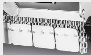
Láminas con cadenas de protección atornilladas