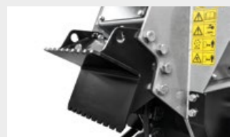
Pulgar fijo frontal