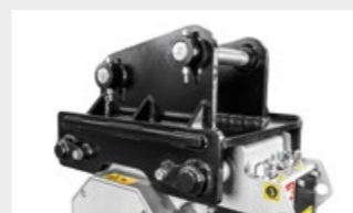
Kit soporte de acople con pasadores sobre medidas