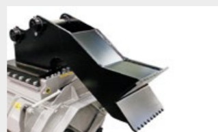
Soporte de acople con pasadores sobre medidas y pie de apoyo

Ajuste de Motor VT regulación específica (ad hoc) del motor para obtener el máximo rendimiento de cualquier sistema hidráulico