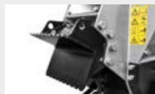
Pulgar fijo frontal