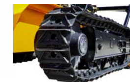
RAUPENKETTE AUS STAHL (Option)