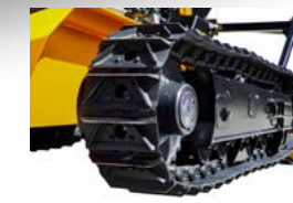
RAUPENKETTE AUS STAHL (Option)

Hydraulisch verstellbares Raupenfahrwerk mit beidseitig unabhängig voneinander einstellbaren Laufwerken und einem automatischen Spannsystem. Dieses arbeitet dank der Gummiketten, des Systems mit Walzen und der Leitrollen auch unter schwierigsten Bedingungen.