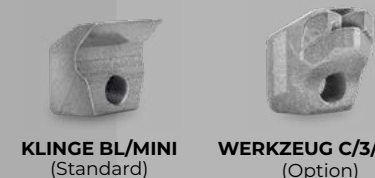
KLINGE BL/MINI (Standard) WERKZEUG C/3/MINI (Option)