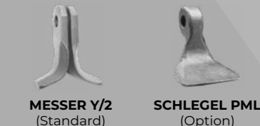
MESSER Y/2 (Standard) SCHLEGEL PML (Option)