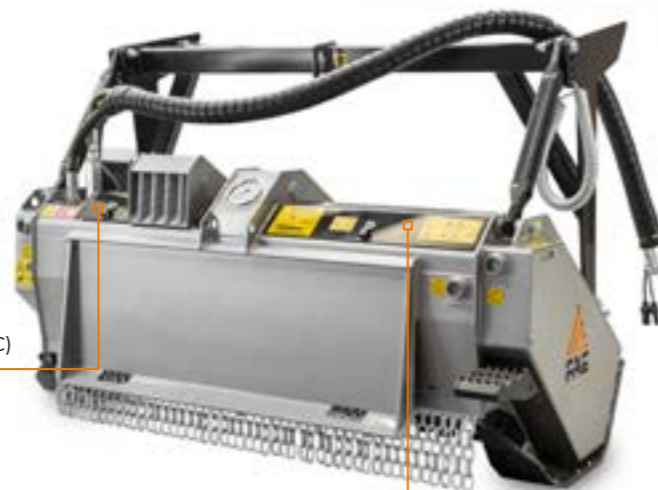
Motor "VT" (Variable Torque) mit automatischer Drehmomentregelung (DML/SSL/VT und DML/SSL/BL)