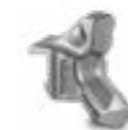
WERKZEUG G/3 (Standard)