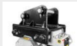
Maßgefertigte Anbauplatte mit Bolzen