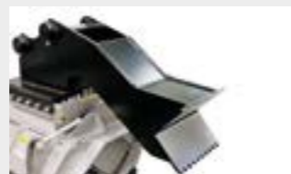
Personalisierte Anbauplatte mit Bolzen und Räumschild

Motorkalibrierung "VT" individuelle Einstellung des Motors, um die maximale Leistung jedes Hydrauliksystems zu erzielen