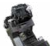
Vordere hydraulische Schutzklappe

Motorkalibrierung "VT" hydraulischer Kolbenmotor mit variablem Drehmoment zur Erhöhung der Leistung und Senkung der Betriebskosten, Perfekt vor Stößen und Schmutz geschützt